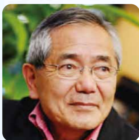
Ei-ichi Negishi Purdue University