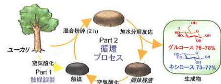
図3. 弱酸性炭素によるバイオマス分解の循環プロセス

その後はグルコースの合成に焦点を絞り研究を進めています。最近、私たちは強い酸をもたない活性炭でも反応が進むことを見つけ、活性炭上の弱い酸が触媒として働くことを明らかにしました。そして、バイオマス自身から弱酸性炭素触媒をつくり、バイオマスを分解させる循環プロセスを構築しました（図3）。この方法では安い原料から触媒を作ることができるので、セルロース分解の実用化が視野に入ってきました。近いうちに、バイオマスからプラスチックやバイオマス燃料をつくるのが可能になると期待しています。